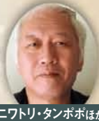
ニワトリ・タンポポほか 安田 晋 (はびぶべパペット)